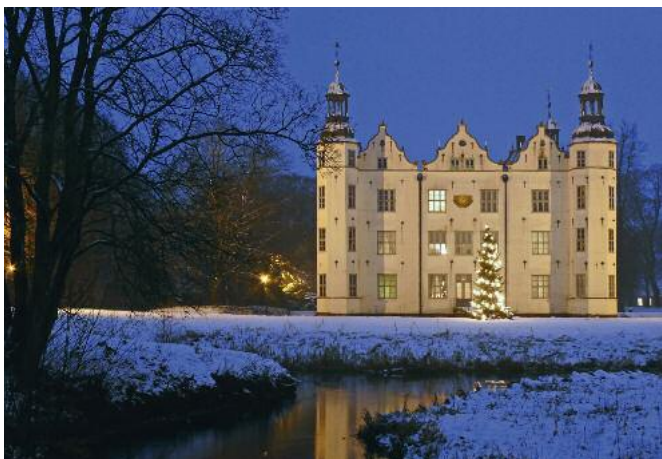
Das Schloss zur Adventszeit

16. und 17. Dezember von 16.30 bis 18.30 Uhr