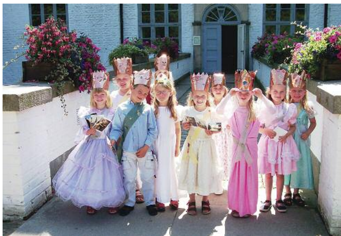
Ferienprogramme für unsere kleinen Gäste