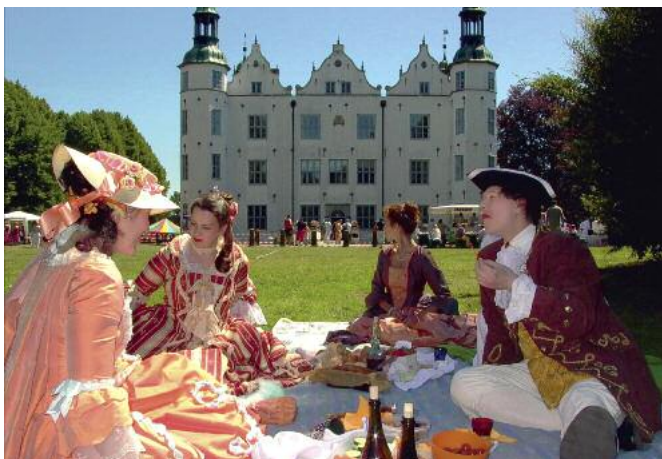
Ein abwechslungsreiches Programm am Internationalen Museumstag