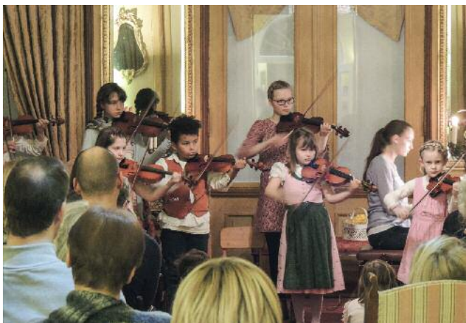
Musikalische Spielereien von Mozart für große und kleine Besucher

Samstag, 04. Februar, 17.00 Uhr – Gartensaal