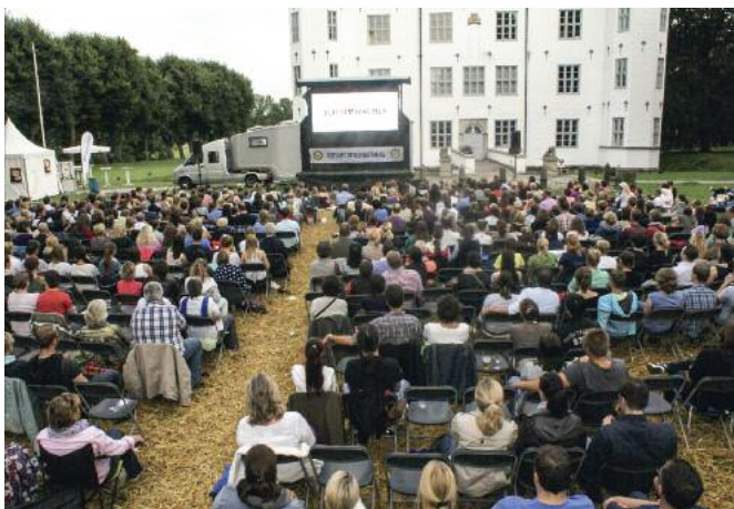
Open-Air-Kino-Wochenende vor imposanter Kulisse