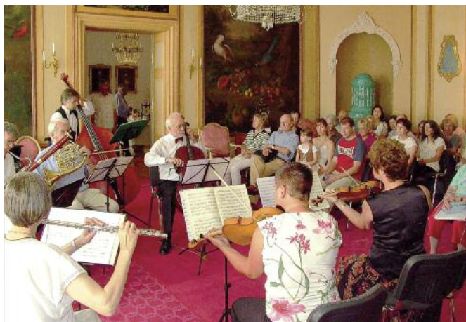
Konzerte im Gartensaal des Schlosses