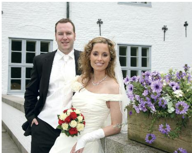
Heiraten im Schloss Ahrensburg