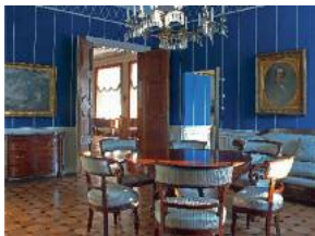
Blaues Wohnzimmer. Restaurierung 2012 vom Freundeskreis finanziert.

Bitte informieren Sie sich unter www.freundeskreis-schloss-ahrensburg.de .